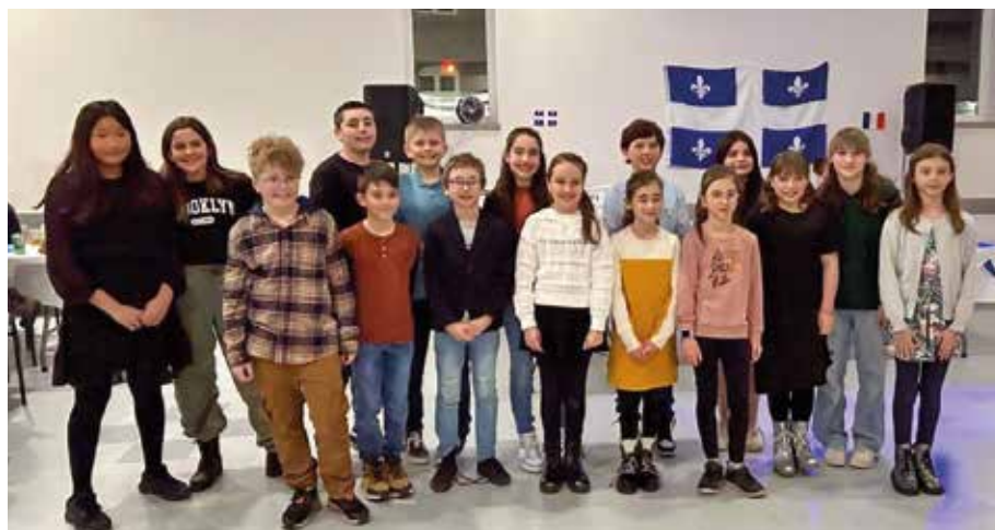
Photo des étudiants prise lors du souper spaghetti du 24 février dernier.